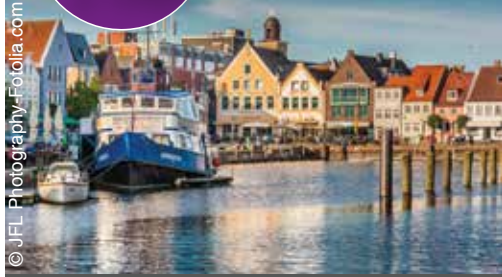
zu Besuch in der Hafenstadt Husum