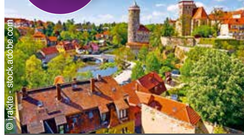
Görlitz, Muskauer Park und Zittauer Gebirge